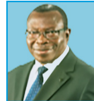
MHESHIMIWA PHILIP ISDOR MPANGO MAKAMU WA RAIS