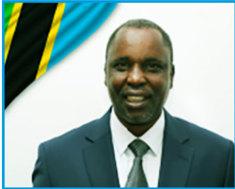
MASHIMBA MASHAURI NDAKI (MB) WAZIRI WA MIFUGO NA UVUVI