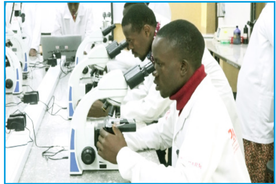
Baadhi ya wanafunzi wa Wakala ya Vyuho vya Mafunzo ya Mifugo (LITA) Kampasi ya Tengeru jijini Arusha wakifanya uchunguzi wa sampuli za magonjwa mbalimbali ya mifugo