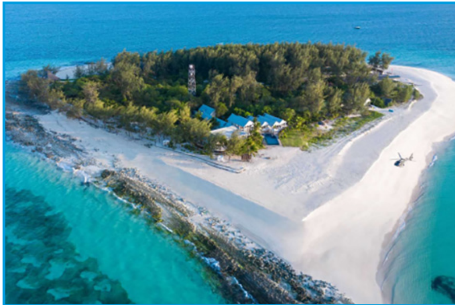
Hoteli ya nyota tano ya Thanda iliyopo kisiwa kidogo cha Shungimbili katika Eneo la Hifadhi ya Bahari Wilaya ya Mafia Mkoani