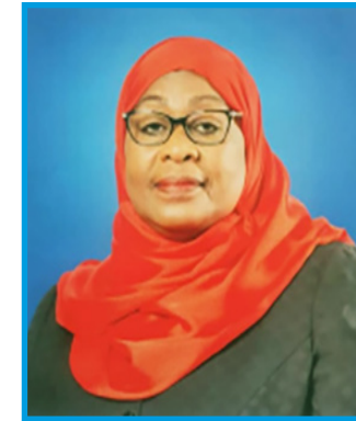
MHESHIMIWA SAMIA SULUHU HASSAN RAIS WA JAMHURI YA MUUNGANO WA TANZANIA