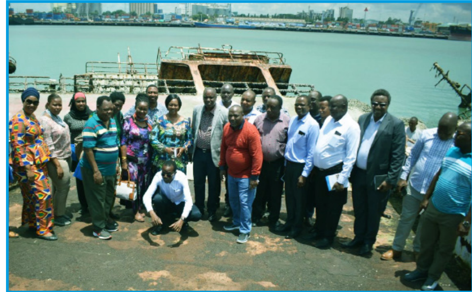
Picha ya pamoja ya Waziri wa Mifugo na Uvuvi, Mhe. Mashimba Ndaki na Wajumbe wa Kamati ya Kudumu ya Bunge ya Kilimo, Mifugo na Maji na wataalam kutoka Sekta ya Uvuvi mara baada ya kukagua ukarabati wa majengo na miundombinu ya Shirika la Uvuvi Tanzania (TAFICO) jijini Dar es Salaam