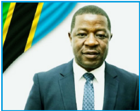
ABDALLAH HAMIS ULEGA (MB) NAIBU WAZIRI WA MIFUGO NA UVUVI