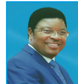
MHESHIMIWA KASSIM MAJALIWA MAJALIWA WAZIRI MKUU