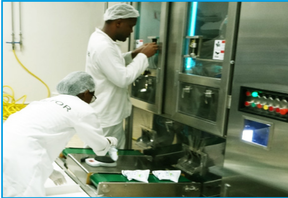
Uwekezaji wa viwanda vya kuchakata maziwa nchini umewezesha kuhamasisha wafugaji kufuga kisasa na kuendelea kuchochea ongezeko la viwanda hivyo