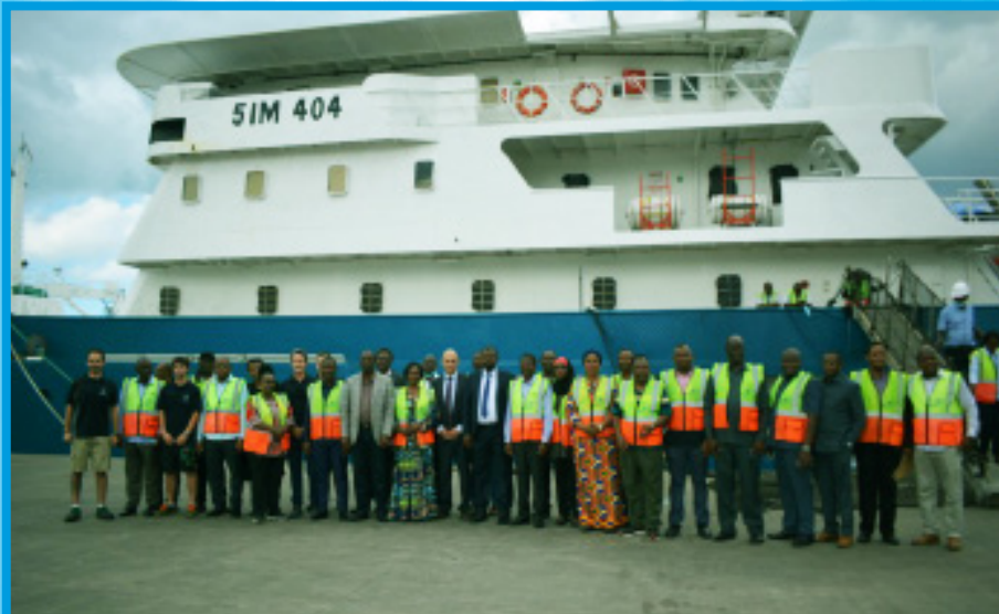
Picha ya pamoja ya viongozi na wataalam kutoka Wizara ya Mifugo na Uvuvi (Tanzania Bara) na Wizara ya Uchumi wa Buluu (Zanzibar), wajumbe wa Kamati ya Kudumu ya Bunge ya Kilimo, Mifugo na Maji pamoja na wamiliki na wataalam wa meli ya MV-PACIFIC STAR mara baada ya kukabidhi leseni na kibali cha uvuvi jijini Dar es Salaam

KIMEPIGWA CHAPA NA MPIGACHAPA MKUU WA SERKALI, DODOMA-TANZANIA